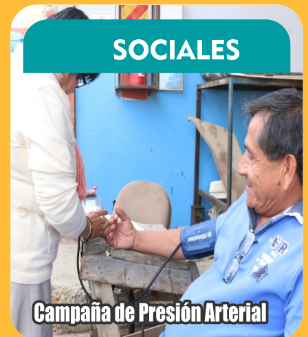
Campaña de Presión Arterial