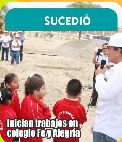
Inician trabajos en colegio Fe y Alegría